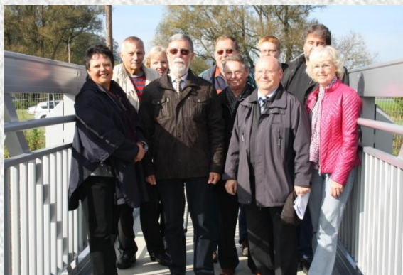
Der Vorstand im Jahr 2012